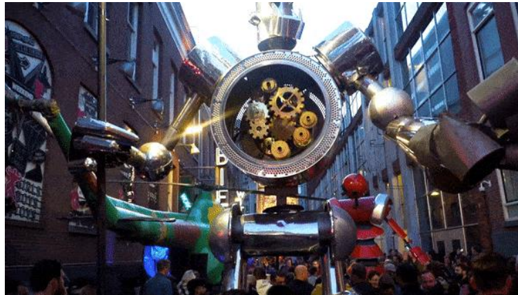
Sfeerimpressie TEC ART '22 ( klik hier voor de volledige video )

heel veel anderen - en zijn drugs voor veruit de meeste subculturen een wezenlijk aspect van het maatschappelijke leven, ondanks potentiële gevaren. Het is niet voor niets dat drugs in populaire cultuur een prominente rol speelt, van Aldous Huxleys dystopische Soma tot The Culture's utopische drug glands van sci-fi schrijver Ian M. Banks. Keynote speakers en kunstenaars geven tijdens het TEC ART Festival hun visie: welke relatie hebben onze lichamen in de toekomst tot drugs, en hoe zal de maatschappij zich hiertoe verhouden?