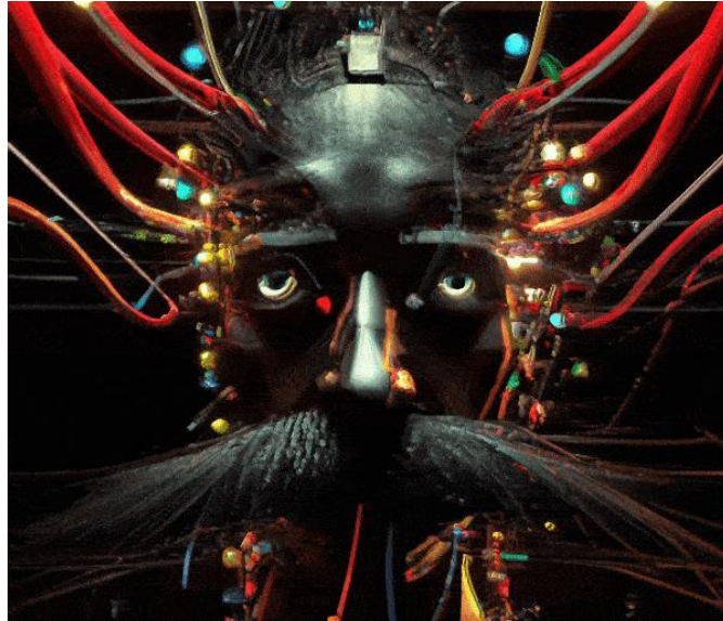
Dall-E 2 (door Arno Coenen, Olivier Teepe, Rodger Werkhoven en Suzyonekenobi)

grote namen en grensverleggende talenten nemen het centrum van Rotterdam over