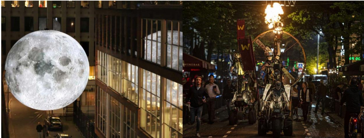
Links: Luke Jerram - Museum of the Moon (TEC ART '17). Rechts: Abacus Theater - Wastelanders (TEC ART '22 Cyberpunk-optocht in de Witte de Withstraat)

In de zomer van 2021 maakte TEC ART een tussenlanding in Brutus (voorheen AVL Mundo) om daar samen met Stichting Niet Normaal INT de megamanifestatie FAKE ME HARD te organiseren. In 2022 was er een eenmalige lente-editie van TEC ART.