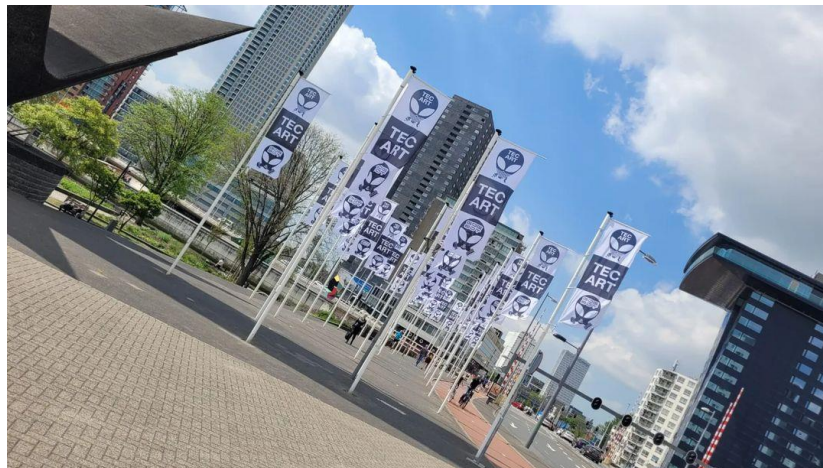
TEC ART bij de Vlaggenparade naast de Erasmusbrug